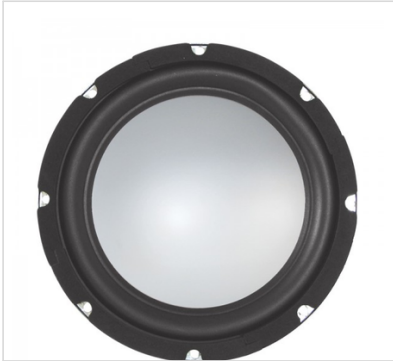
Hauptansicht – Frontseite (Alu-Membran, 200 mm)

Rockwood 200mm Subwoofer m. Alu-Membrane 200Watt 4 Ohm