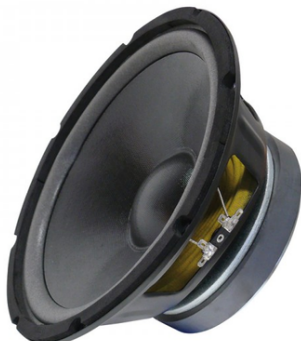
Hauptansicht – 250-mm-Chassis (schwarz)